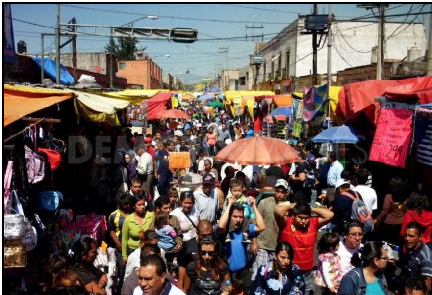
Document 3 : Tepito, un quartier de contrastes, 2013