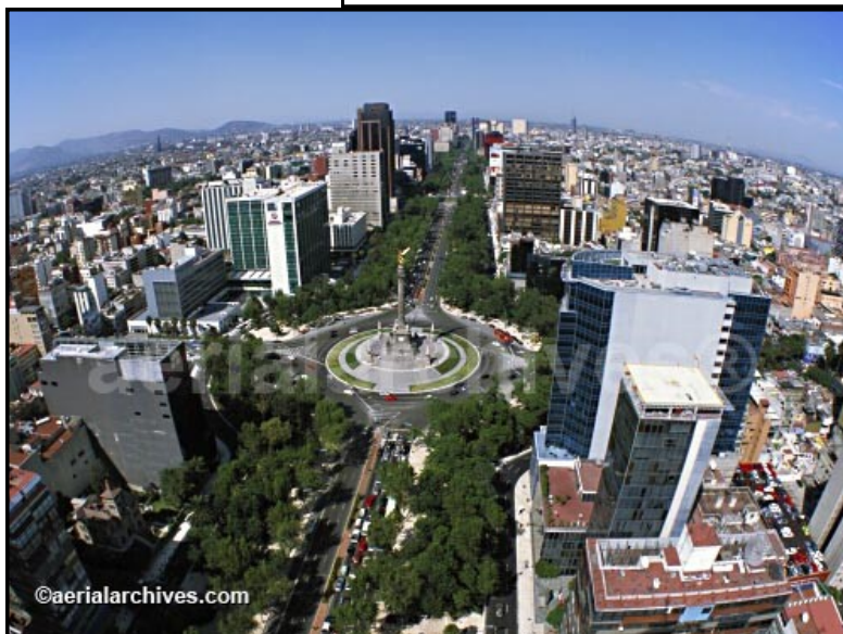
Document 5 : Deux témoignages d'un Français vivant à Mexico

On y trouve des tours de bureaux, des logements pour très hauts revenus, un grand espace vert, quatre universités et un des plus grands centres commerciaux d'Amérique latine.