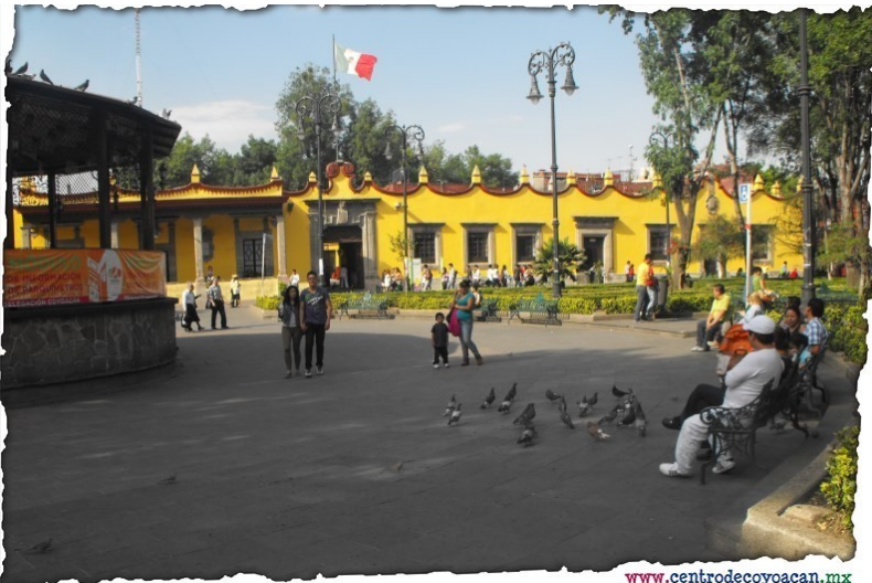
Document 4 : Le quartier de Coyoacan, 2014.

A l'époque de l'Empire Aztèque, la ville s'appelait Tenochtitlan. Se trouvaient sur cette place le temple majeur et le palais impérial. Aujourd'hui, on y trouve la cathédrale majeure (à gauche) et le palais national (à droite), siège officiel du président de la République du Mexique.