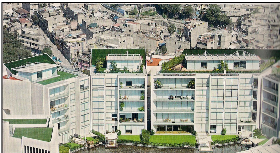
Document 3 : Le quartier de Santa Fe au sud-ouest du centre historique, 2015

Au premier plan, une résidence de luxe pour des habitants disposant de hauts revenus.