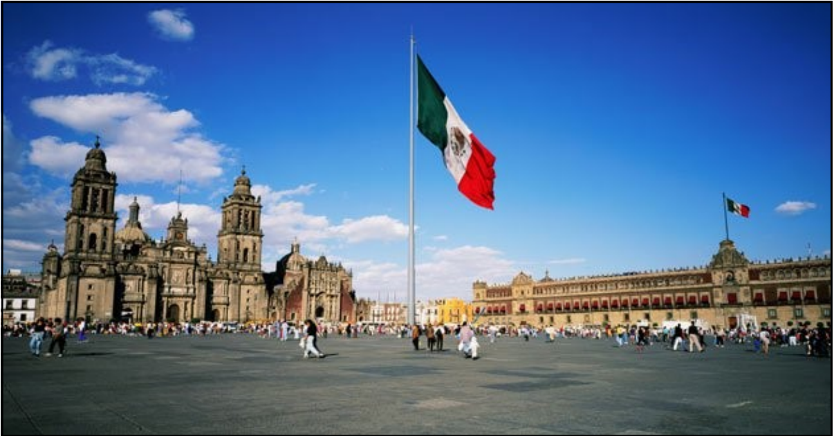
Document 3 : La Place du Zocalo, cœur historique de Mexico, 2015

A l'époque de l'Empire Aztèque, la ville s'appelait Tenochtitlan. Se trouvaient sur cette place le temple majeur et le palais impérial. Aujourd'hui, on y trouve la cathédrale majeure (à gauche) et le palais national (à droite), siège officiel du président de la République du Mexique.