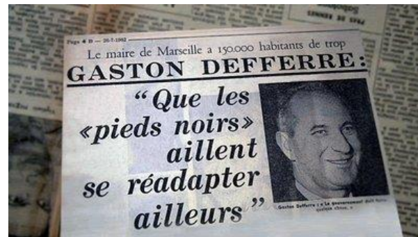
G. Defferre, maire en Marseille en 1962