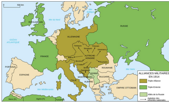
L'Europe en 1914 à la veille du conflit, ses alliances militaires et ses pays neutres