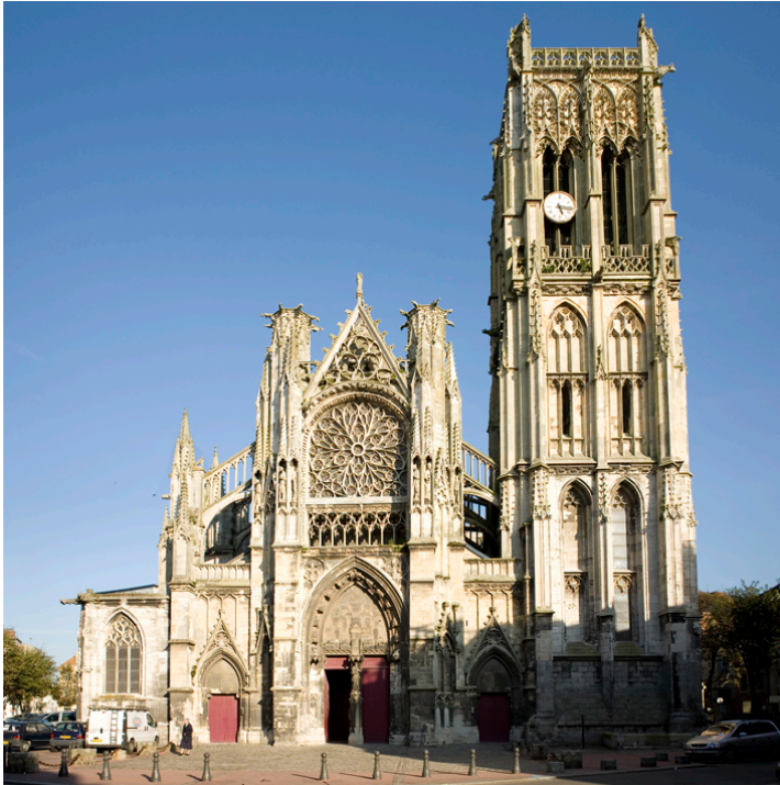
Photo : Localisation de la frise sur le mur du Trésor

https://commons.wikimedia.org/wiki/File:Dieppe,_église_Saint-Jacques-PM_07150.jpg