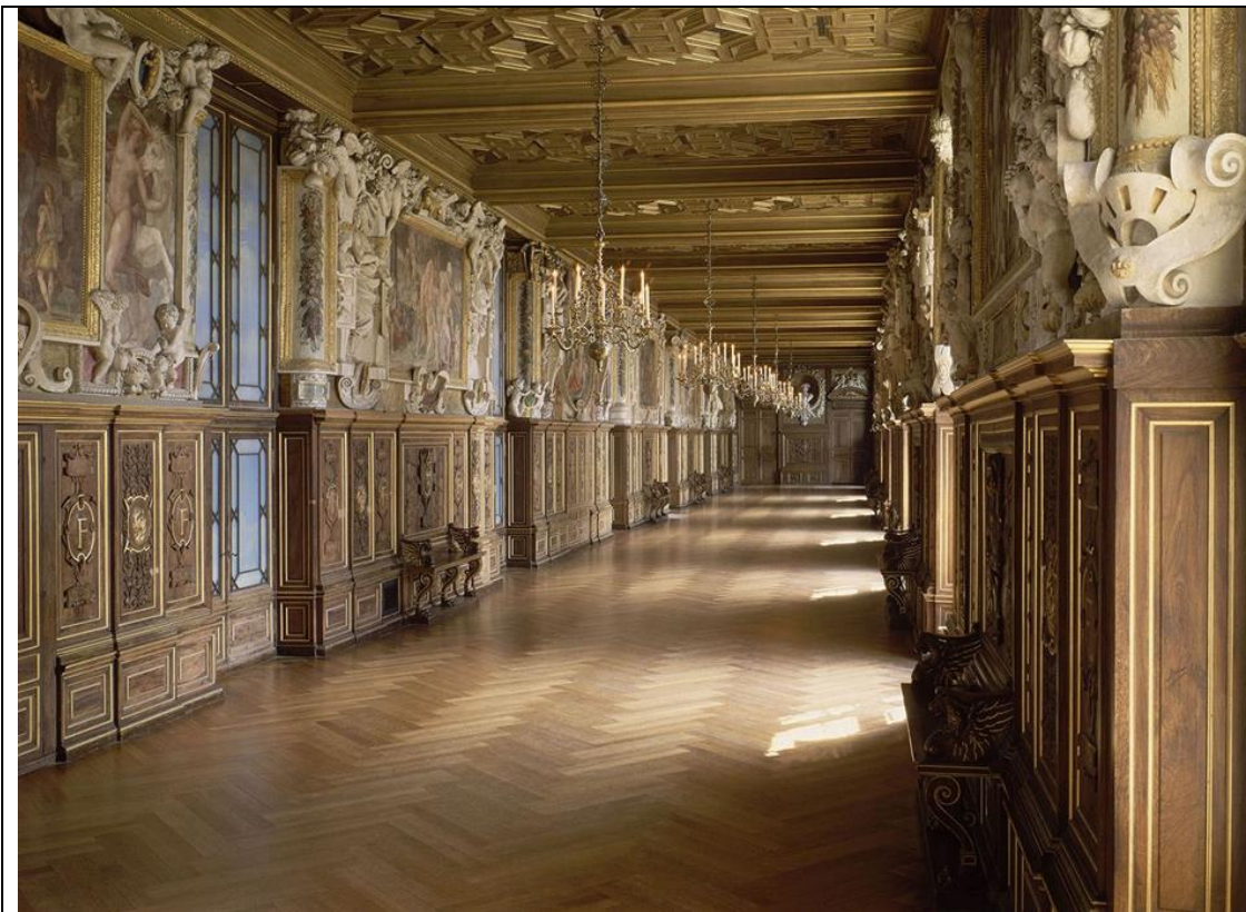
Détail (la salamandre, les devises de François I er )