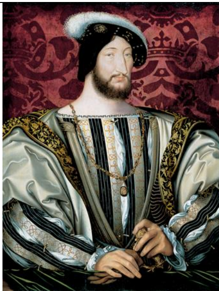
Tiziano Vecellio, dit Titien, Portrait de François I er , 1539, Musée du Louvre, Paris