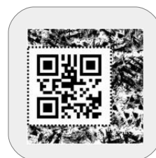
Marqueur Plan des ruines