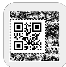
Marqueur Style roman / Style gothique