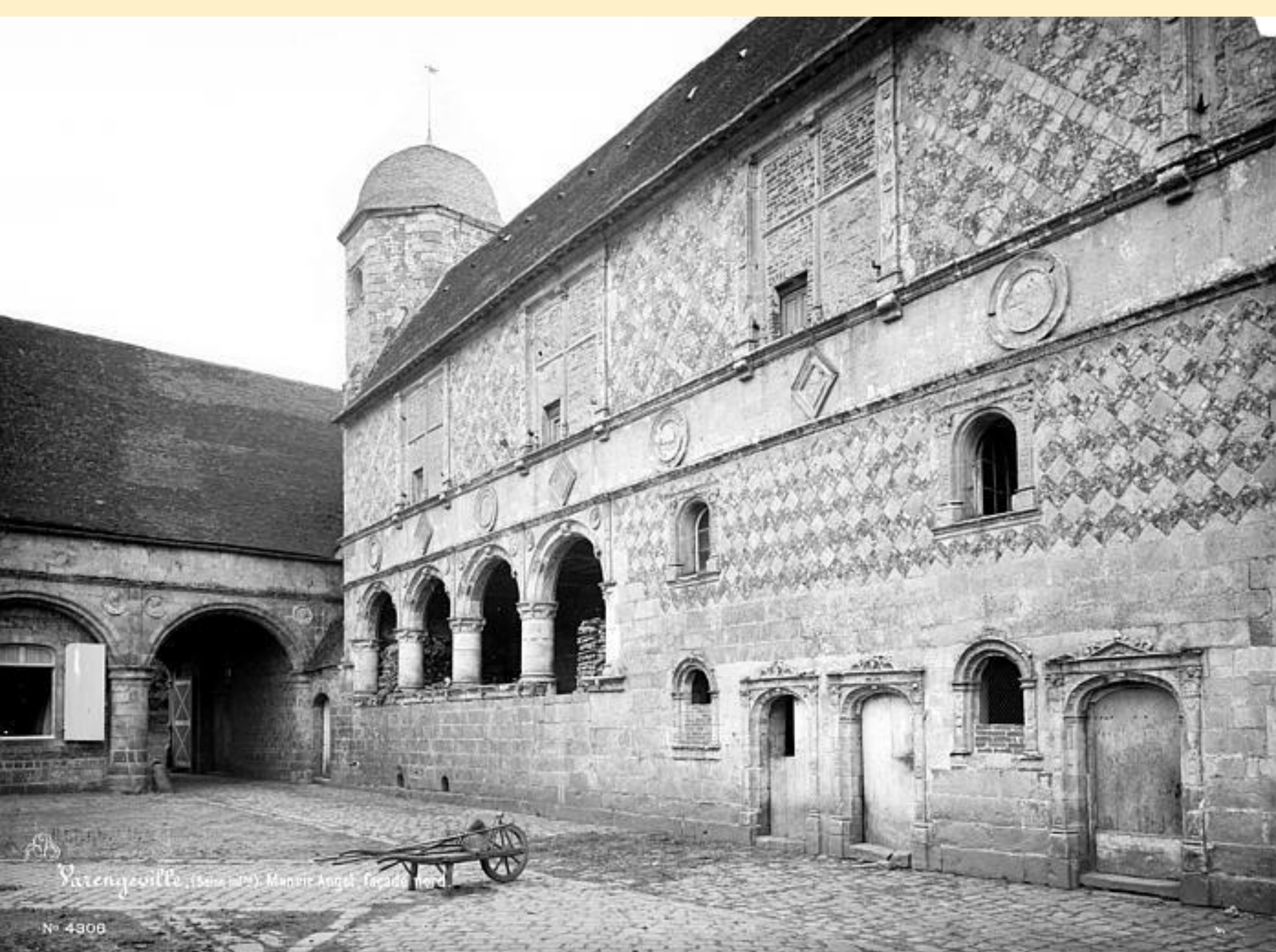
Varengeville (Seine-Maritime). Mairie. Anglet. Facade nord.