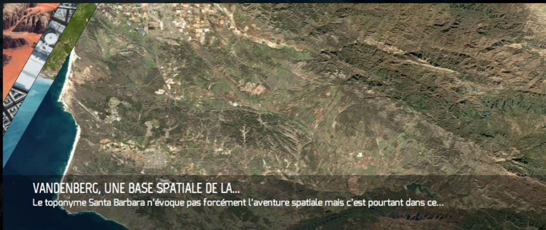
VANDENBERG, UNE BASE SPATIALE DE LA... Le toponyme Santa Barbara n'évoque pas forcément l'aventure spatiale mais c'est pourtant dans ce...