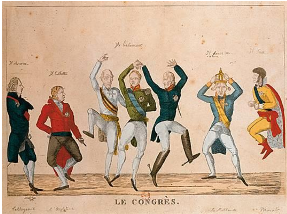
Caricature de Forceval

Présentation du contexte par l'enseignant: