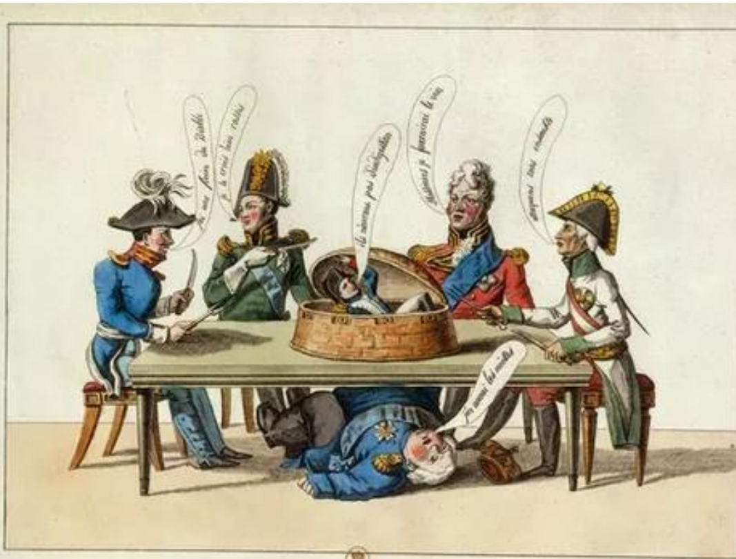
LE PATÉ INDIGESTE

Dans le plat, Napoléon, et Louis XVIII sous la table.